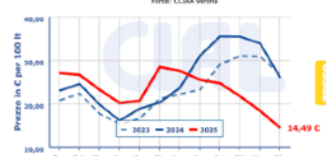
Italia, Verona - Prezzo del Latte scremato pastorizzato, spot estero (0,03% m.g. sfuso in cisterna, franco arrivo in Lattieria)

Latte scremato pastorizzato est. Latte spot BIO nazionale